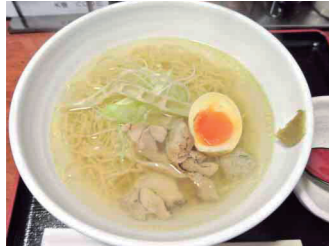
⑤生親子丼、⑥鶏らーめん